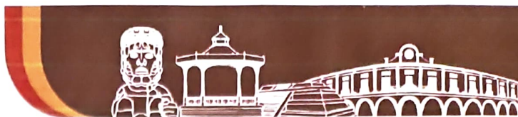
Tabla 58. Infraestructura del deporte en Tenango del Valle 2020.